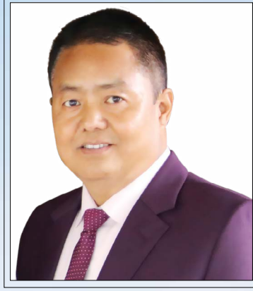
दयाश्रम पुन अध्यक्ष